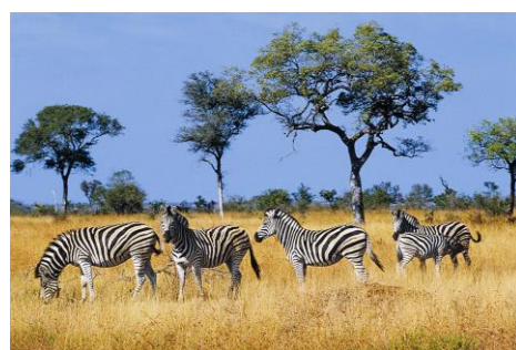
Zebras im Nationalpark