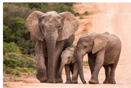
Elefanten im Krüger Nationalpark