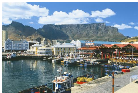
Kapstadt - Tafelberg

Trinkgelder, Zusätzliche Mahlzeiten und jegliche Getränke, persönliche Ausgaben, Reiseversicherungen.