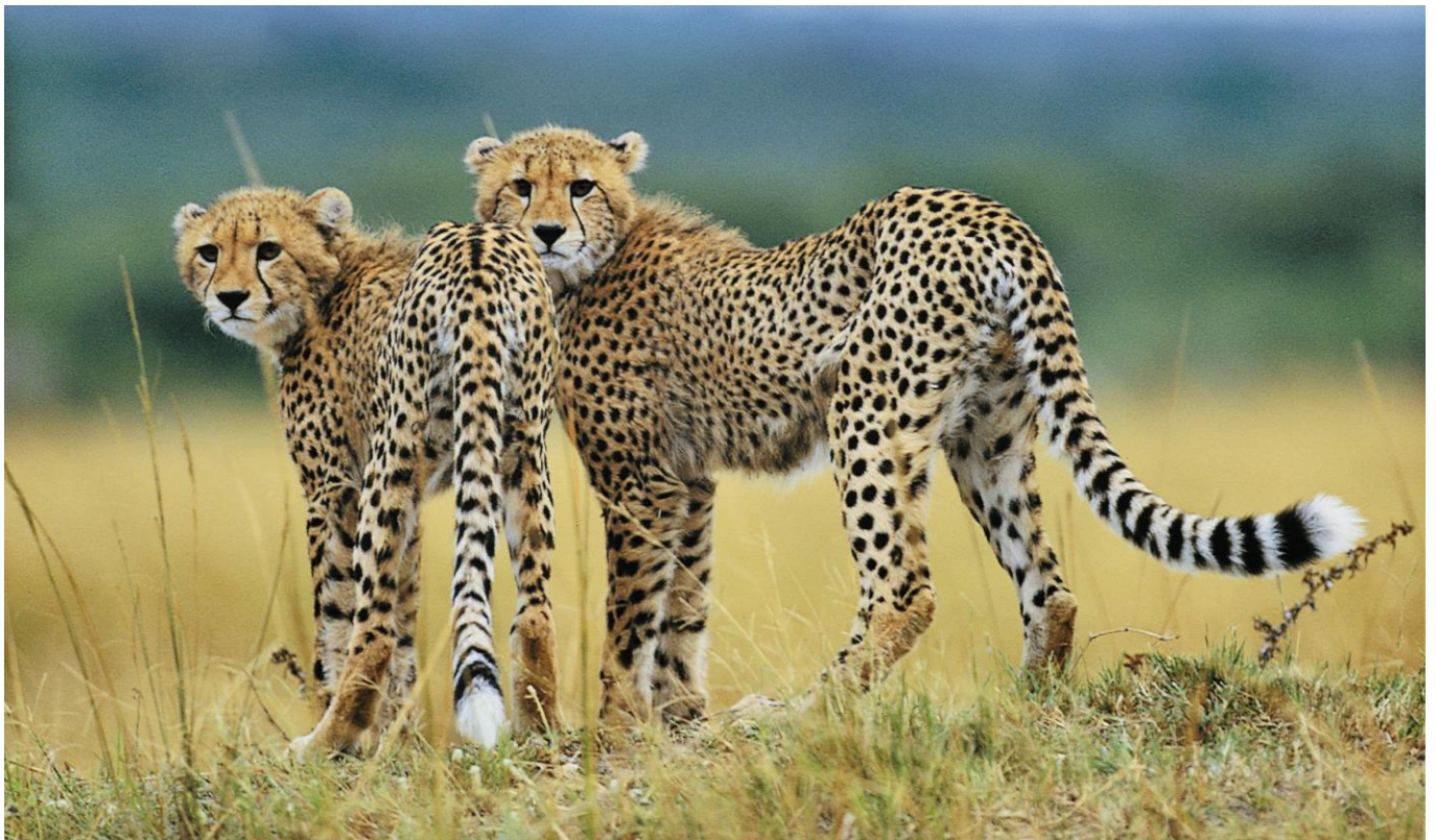
Geparden im Krüger Nationalpark

Lernen Sie während dieser 16-tägigen ausführlichen Südafrika Rundreise die atemberaubenden Gegensätze dieses vielseitigen Landes kennen. Afrika ist nicht nur der zweitgrößte Kontinent der Welt – es ist eine Welt für sich. Großartige Aussichten am Blyde River Canyon oder die einmalige Tierwelt Südafrikas im Krüger Nationalpark bei einer mehrstündigen Pirschfahrt. Erleben Sie Berge, Wälder, Meer und elegante Ferienorte entlang der berühmten Garden Route. Lassen Sie sich begeistern von den alten Weingütern im bekannten Winzerland Stellenbosch hinter dem Tafelberg, dem weltbekannten Kap der Guten Hoffnung und von der faszinierenden Metropole Kapstadt, eine der schönsten Städte der Welt. Kommen Sie mit auf diese wunderschöne und hochinteressante Entdeckungsreise durch Südafrika.