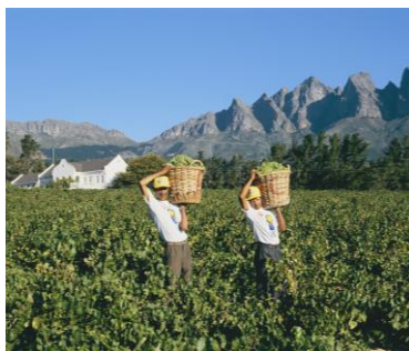
Weinlese bei Stellenbosch